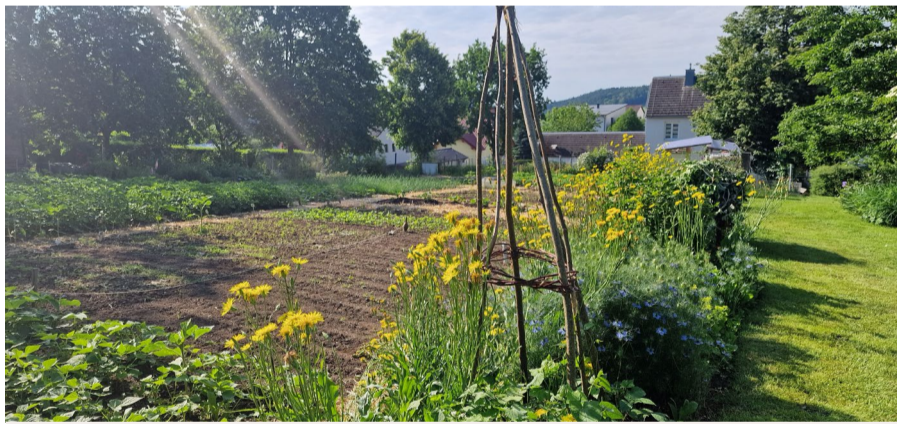
Liebingsplatz Michaela Fröhlich (Gemeinschaftsgarten)