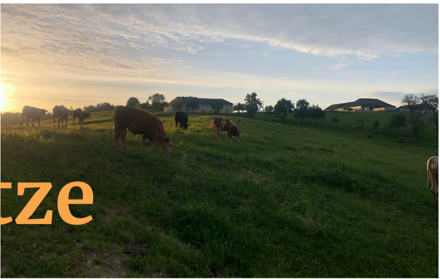
Liebingsplatz Victoria Danmayr (Zuhause am Hof)

Bad Zell ist für uns alle ein sehr schöner Platz zum Leben, den wir bewahren aber auch mitgestalten und weiterentwickeln wollen. Wir alle leben gerne hier und haben auch unser ganz persönliches Lieblingsplatzl.