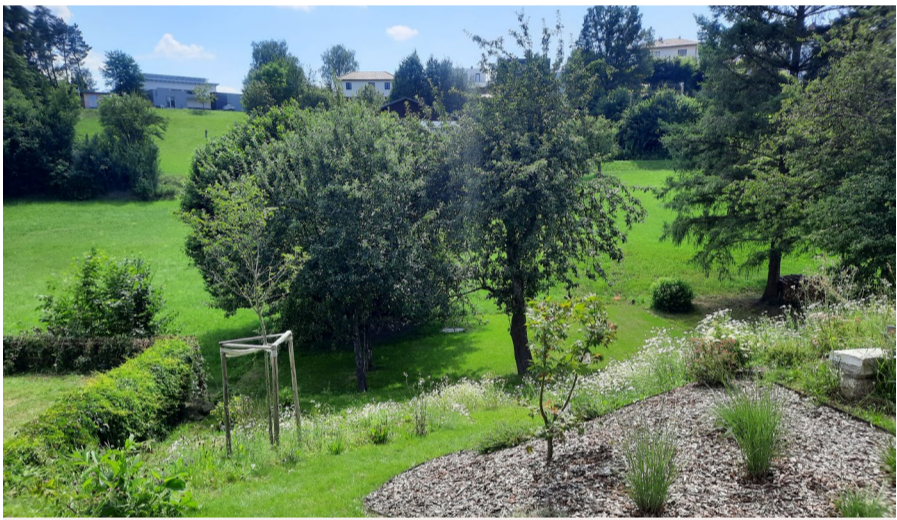
Liebingsplatz DI Rupert Höfer (Blick in den Hoisgarten)