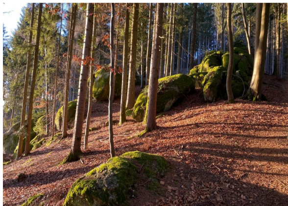
Liebingsplatz Fred Hofko (Am Ellerberg)