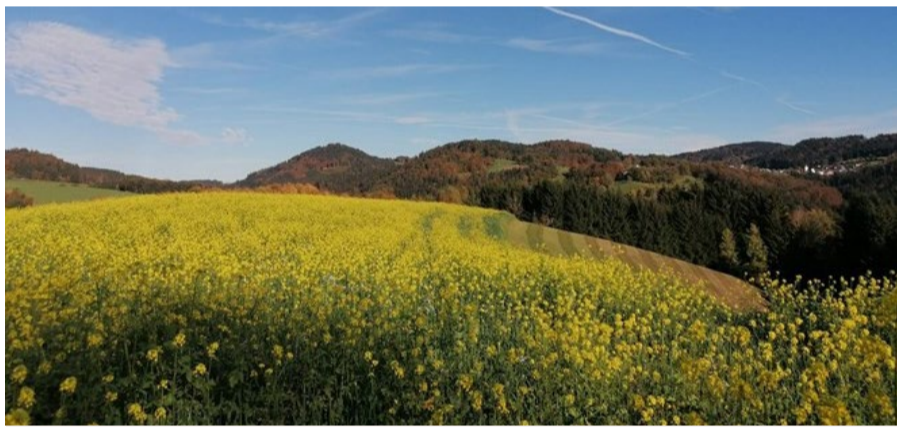
Liebingsplatz Johannes Skopetz (Blick von der Terrasse)